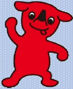
千葉県マスコットキャラクター「チーバくん」