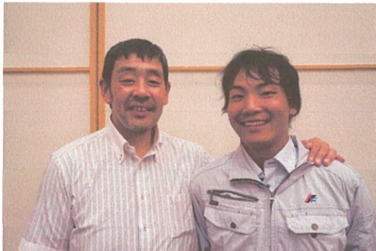
当社工事部長(左)と入社6ヶ月の期待の新人☆